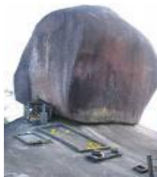
รอยพระพุทธรูป เขาศิขมกภู

ราคา 700 บาท รวมอาหารเช้า ไม่รวมรถขึ้นเขา