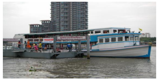
พระสงฆ์นำสวดคาถาบูชาพระเคราะห์บนเรือ