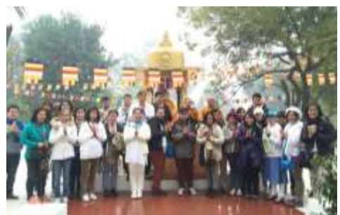
วัดเวฬุวันแห่งแรกของโลก : ราชคฤห์