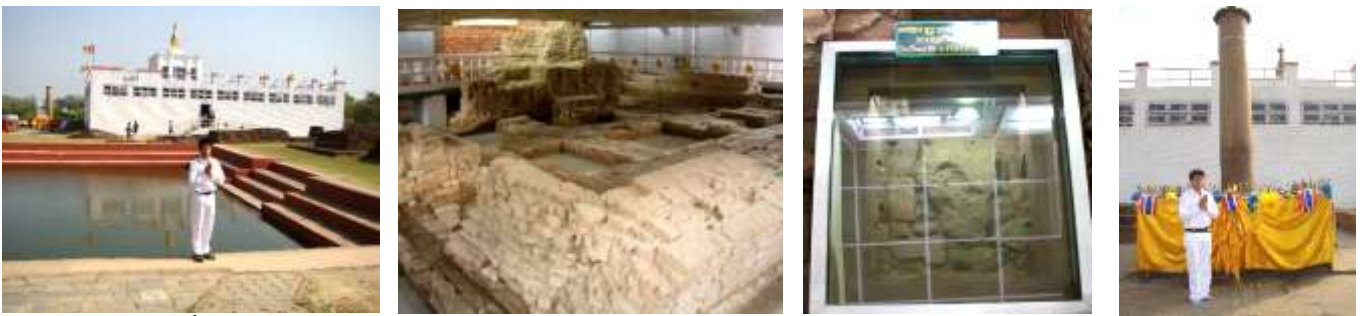
ลุมพินี : สถานที่ประสูติ (เนปาล) มายาเทวีวิหาร อนุสรณ์การประสูติ รอยพระบาท 1 ใน 7 ก้าว (มรดกโลกสถาน)

06.00 น.-บริการอาหารเช้าที่โรงแรมฯ/ที่วัด+ออกเดินทางสู่ “สวนลุมพินี” เดินทางเท้าไปประมาณ 500 เมตร (จากจุดจอดรถ)