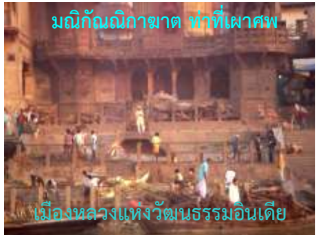
มณิกรรณิกามาต ทำที่เผาศพ