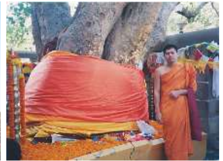
ต้นพระศรีมหาโพธิ์ สถานที่ตรัสรู้