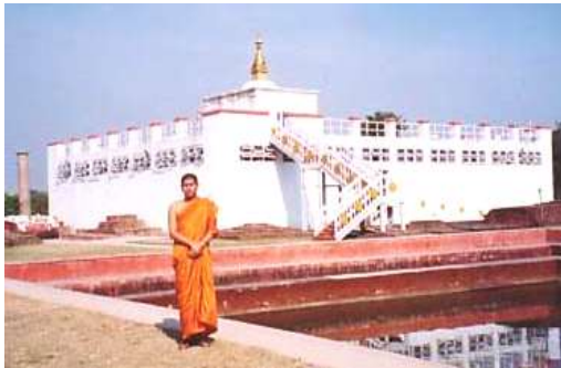
สวนลุมพินี : สถานที่ประสูติ (เนปาล)

ทัวร์อินเดีย-เนปาล A : ครบ 4 ตำบล 9 พุทธสถาน (7 คืน/8 วัน) ตามรอยบาทพระศาสดานมัสการ สังเวชนียสถาน 4 ตำบล (1) สถานที่ประสูติ (ลุมพินี) มายาเทวีวิหาร เสาหินอโศก (2) ที่ตรัสรู้ ต้นพระศรีมหาโพธิ์ (พุทธคยา) เจดีย์พุทธคยา พระพุทธเมตตา (3) ที่แสดงปฐมเทศนา (สารนาถ) อิสิปตนมฤทายวัน (4) ที่ปรินิพพาน (กุสินารา) सालวโนทยาน (5) ราชคฤห์ เวฬุวัน ดโธธาราม เขาคิชฌกูฏ (6) นาลันทามหาวิทยาลัย หลวงพ่อดำ (7) เวสาลี ปาวาลเจดีย์ วัดป่ามหาวัน (8) สาวัดดี เขตวันมหาวิหาร ยมกปาฏิหาริย์-พาราณสี ล่องเรือคงคา (9) กบิลพัสดุ์ นครพุทธบิดา