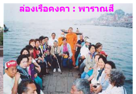
ล่องเรือคงคา : พาราณสี

ดูก่อนอานนท์ สังเวชนียสถาน 4 ตำบล คือ สถานที่เราตถาคตเจ้าประสูติ (ลุมพินี) 1, สถานที่เราตถาคตเจ้าตรัสรู้เป็นพระ อนุตรสัมมาสัมโพธิญาณ (พุทธคยา) 1, สถานที่เราตถาคตเจ้าแสดงปฐมเทศนาธรรมจักกัปปวัตตนสูตร (สารนาถ) 1, สถานที่ เราตถาคตเจ้าเสด็จดับขันธปรินิพพาน (กุสินารา) 1, สถานที่ทั้ง 4 ตำบลนี้แล ควรที่พุทธบริษัท คือ ภิกษุ ภิกษุณี อุบาสก อุบาสิกา ผู้มีความเชื่อความเลื่อมใสในพระตถาคตเจ้า ควรดู (นมัสการ) และควรจะทำให้เกิดความสังเวททั่วกัน