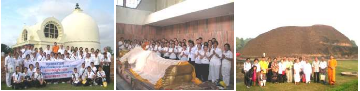
สาละวนททยาน : กุสินารา สถานที่ปรินิพพาน พระพุทธปรินิพพาน สร้าง พ.ศ. 950 มกุฏพันธเจดีย์ ถวายพระเพลิงพระพุทธศรีระ

06.00 น.- บริการอาหารเช้าที่วัดไทย/โรงแรม+เดินทางสู่ “สาละวนททยาน” สถานที่ปรินิพพาน (ทัวร์จัดเตรียมผ้าห่มพระแล้ว) เช้า นมัสการ (1) ปรินิพพานสถูป ซึ่งพระเจ้าอโศกสร้างครอบสถานที่ปรินิพพานของพระพุทธเจ้า+(2) ปรินิพพานวิหาร ซึ่งโอปุคยู และอุโปแหล่ง ชาวพม่าสร้างถวาย พ.ศ.2470 นำคณะสวดมนต์เจริญสมาธิภาวนา ณ เบื้องหน้าองค์ พระพุทธอนุฐานุสสุไสยาสน์ พระนอนปางปรินิพพาน ซึ่งนายช่างชาวเมืองมฤธาชื่อ “ถินา” สร้าง พ.ศ.950 + นมัสการ (3) มณฑป ที่ประดิษฐานพระพุทธศรีระ+(4) มกุฏพันธเจดีย์ สถานที่ถวายพระเพลิงพระพุทธศรีระ