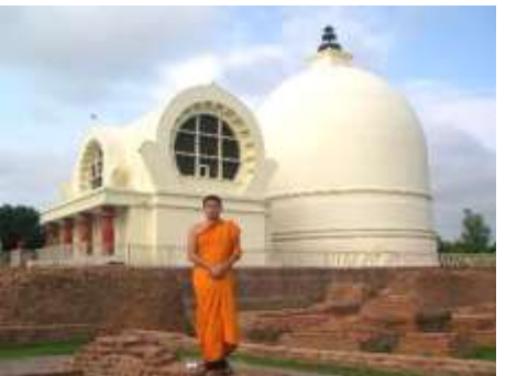
ปรินิพพานสฤป : สถานที่ปรินิพพาน