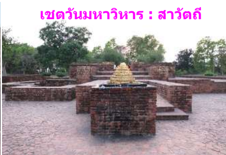
เขตวันมหาวิหาร : สาวัดดี