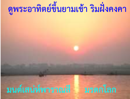
ดูพระอาทิตย์ขึ้นยามเช้า ริมฝั่งคางคก