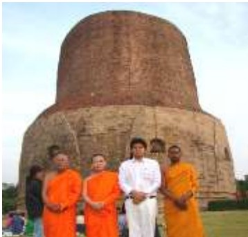
อิสิปตนมฤทายวัน : ปฐมเทศนา सालวโนทยาน กุสินารา : สถานที่ปรินิพพาน