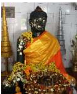
หลวงพ่อดำ

06.00 น. - บริการอาหารเช้า ณ โรงแรม+เดินทางไปราชคฤห์ เมืองหลวงแคว้นมคธที่ยิ่งใหญ่สมัยพระเจ้าพิมพิสาร (70 กม.)