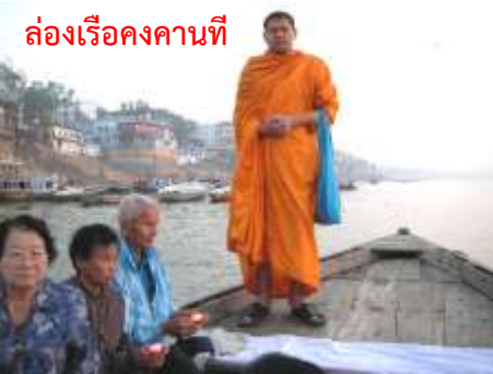
ล่องเรือคางคกนี้

05.00 น.- ออกเดินทางไปล่องเรือแม่น้ำคงคา+ชมทำนํ้ามณิกรรณิกา ที่เผาศพซึ่งไฟไม่เคยดับเลยประมาณ 4,000 กว่าปี - ทำทศวมศที่ชาวฮินดูอาบน้ำล้างบาป+ บูชาพระแม่คงคา+บูชาสุริยะเทพ+พระอาทิตย์ขึ้นเหนือริมฝั่งคางคกที่สวยงาม หมายเหตุ : การไปทำนํ้าคางคกปกติทัวร์นิยมไป 2 เวลา คือ เวลารุ่งอรุณ กับเวลาสนธยา เพื่อสัมผัสบรรยากาศของแม่น้ำคงคา ตอนเช้าชมการอาบน้ำยามพระอาทิตย์ขึ้น / ตอนเย็นชมพระอาทิตย์ตกดิน+พิธีคงคาอาระตีการบูชาแม่พระคงคาด้วยระบำไฟ