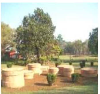
ยมกปาฏิหาริย์