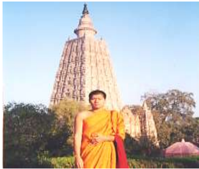
เจดีย์พุทธคยา อนุสรณ์การตรัสรู้