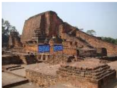
มหาวิทยาลัยนาลันทา