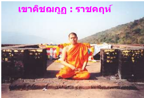
เขาคิชฌกูฏ : ราชคฤห์